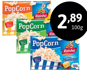
PIPOCA PARA MICROONDAS RAINHA