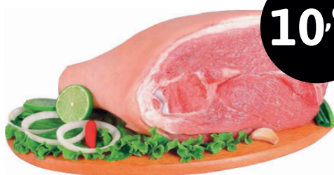
PERNIL OU PALETA SUÍNA