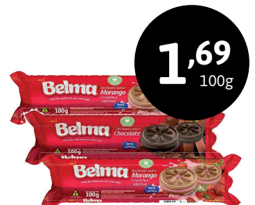
BISCOITO RECHEADO BELMA