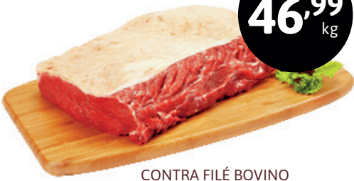
CONTRA FILE BOVINO