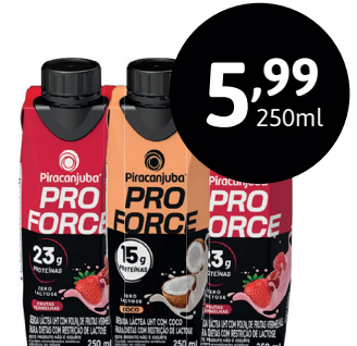
BEBIDA LÁCTEA PROFORCE PIRACANJUBA