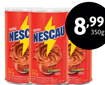
ACHOLOTADO EM PÓ NESCAU