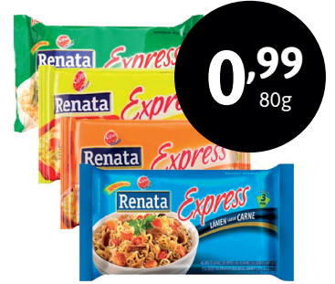
MACARRÃO INSTANTÂNEO RENATA