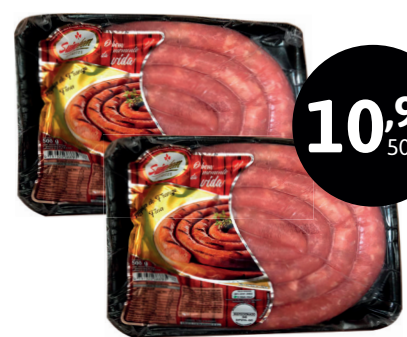
LINGUIÇA SUINO BOM