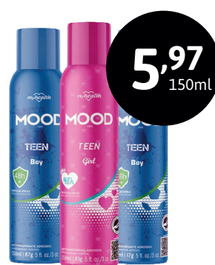
DESODORANTE AEROSOL MOOD