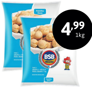
POLVILHO DOCE BSB

O MINISTÉRIO DA SAÚDE ADVERTE: O ALEITAMENTO MATERNO EVITA INFECÇÕES E ALERGIAS E É RECOMENDADO ATÉ OS DOIS ANOS DE IDADE OU MAIS