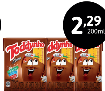
BEBIDA LÁCTEA TODDYNHÔ