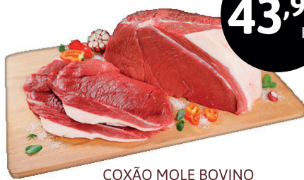
COXÃO MOLE BOVINO