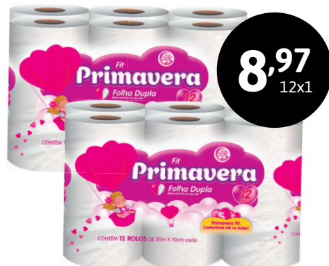
PAPEL HIGIÊNICO PRIMAVERA 20 METROS