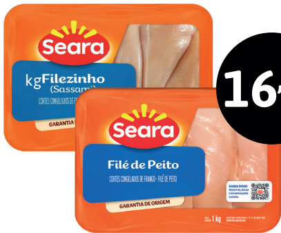
FILE DE PEITO OU SASSAMI SEARA