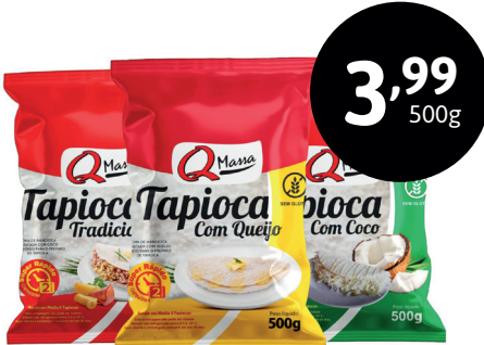
MASSA PARA TAPIOCA Q MASSA