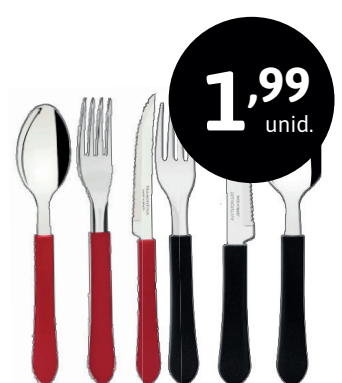
TALHERES TRAMONTINA LEME