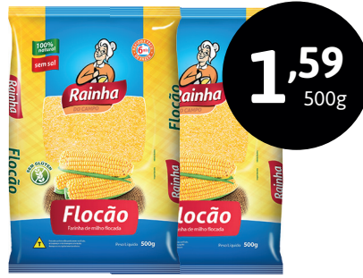
FLOCÃO RAINHA AMARELO