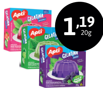
PÓ PARA GELATINA APTI